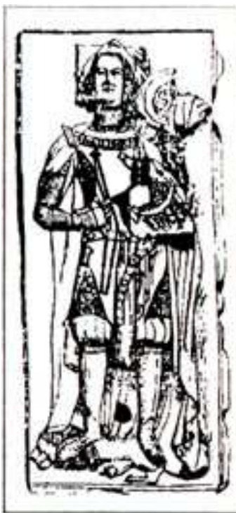
HENRYK V ŻELAZNY

Henryk V rozpoczynając panowanie, nie złożył hołdu królowi czeskiemu, zebrał wojska i wyruszył na podbój Głogowa. Ze zmiennym szczęściem toczył walki z Janem Luksemburskim, a potem z jego synem Karolem. Tymcza-