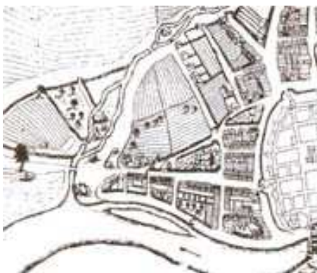
PRZEDMIEŚCIE NA PLANIE Z POCZ. XVII W.

Jednym z powstałych wówczas przedmieść było Przedmieście Polskie. Leżało po wschodniej części miasta lokacyjnego. Nazwane zostało tak ze względu na mieszkającą tutaj dużą liczbę Polaków. Prowadziły do niego Brama Polska i furta Bożego Ciała. Przedmieście zaczęło się rozwijać w drugiej połowie XV wieku, do tego czasu znajdowały się tu ogrody i pola. Około 1530 roku liczba budynków mieszkalnych na przedmieściu dochodziła do 70-ciu. Układ przestrzenny nie był tak regularny jak układ miasta „właściwego”, choć ze wszystkich przedmieść ono miało najbardziej regularny kształt. Główną arterią tej dzielnicy była droga (przedłużenie ulicy Polskiej) prowadząca w kierunku na Wołów. Wzdłuż niej zamieszkiwali tkacze, którzy byli najliczniejszą grupą zajmującą przedmieście. Innymi liczącymi się rzemieślnikami byli garncarze zamieszkujący północną część, wzdłuż murów miejskich. Na przedmieściu znajdował