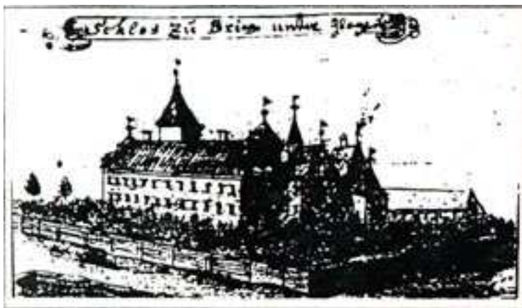
PAŁAC W BRZEGU GŁOGOWSKIM WG. RYSUNKU F. B. WERNHERA Z POŁ. XVIII W.

Pałac w Brzegu Głogowskim usytuowany jest na wzniesieniu opadającym stromo od północy na tereny nadodrzańskich łąk. Po jego wschodniej stronie znajduje się park pochodzący podobnie jak krypta grobowa (na terenie parku) z około połowy XIX w.. Założenie parkowe istniało już w połowie XVIII w.. Rezydencja rycerska w Brzegu Głogowskim powstała w średniowieczu. Pierwsza wzmianka o niej pochodzi z 1319 r.. Właścicielami Brzegu byli przez długi czas aż do drugiej połowy XVI w. członkowie rodu von Glaubitz, oni też najprawdopodobniej zbudowali pierwszą murowaną rezydencję – dwutraktowy renesansowy dwór z około połowy XVI w., który stał się trzonem zachowanej do dziś budowli. Dwór rozbudowano w latach 1671-1685 za sprawą von Herbersteina. Powiększono go wtedy o część południową oraz wykonano wy-