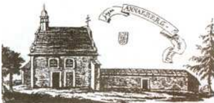
Widok kaplicy – koniec XVIII w.

Literatura: J. Bleschke, Geschichte der Stadt Glogau und des Glogauer Landes, Glogau 1913; H. Hoffmann, Die katcholischen Kirchen in Glogau, 1934; Schematyzm diecezji zielonogórsko-gorzowskiej, 1995 r..